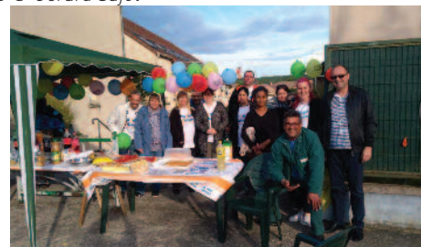
Les locataires de Trilport - zac de la Mère Grand