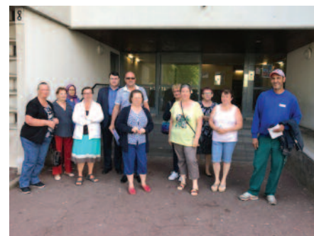
Les locataires de Buffon - la Régie du Pays de Meaux - les équipes de Pays de Meaux Habitat

produits utilisés pour cette prestation ou encore sur des problématiques d'incivilités qui parfois rendent invisible le travail réalisé. Cette démarche participative a également permis d'améliorer le cahier des charges du prochain renouvellement du marché de ménage.