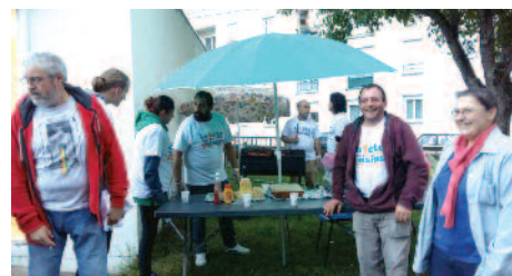
Les locataires de la Grande Île