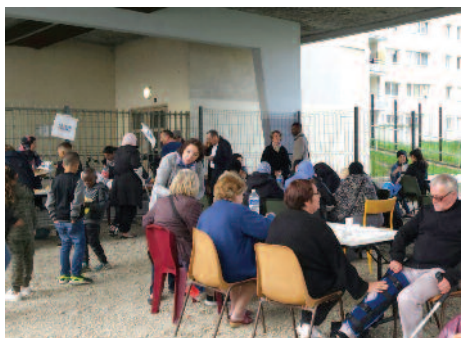
Centre social municipal Louise Michel