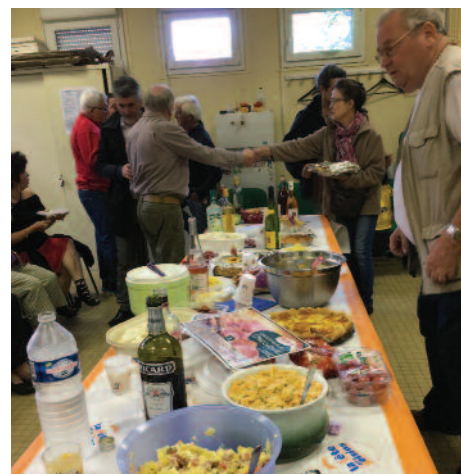
Les locataires du Parc Frot

Retrouvez toutes nos informations sur notre site internet : www.pays-de-meaux-habitat.fr