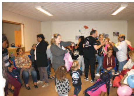
Les locataires de Buffon