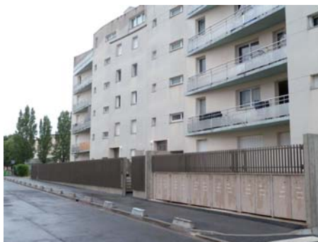
Rue de l'Ourcq - Après travaux Locaux ordures ménagères extérieur avec mise en place du tri sélectif