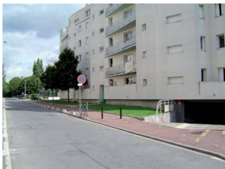
Rue de l'Ourcq Avant travaux