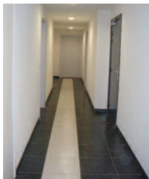
Parties Communes Résidence L'Écluse © Meaux Habitat