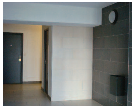
Parties communes Squares A

Vivre en bon voisinage, c'est préserver son cadre de vie, c'est à dire son logement, son environnement (espaces verts, parties communes, aires de jeux...) et également respecter la tranquillité des autres locataires.