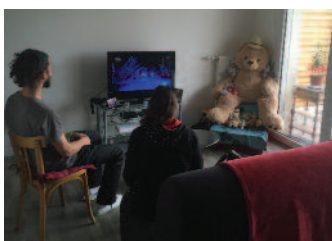
Chez madame Rivière

“Mon plaisir : pouvoir profiter d'un balcon en étant locataire d'un studio”.